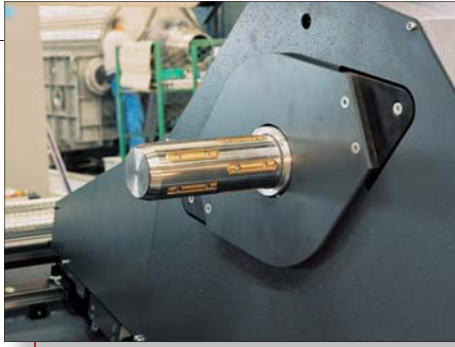
Die standardmäßigen Schnellwechsel-Spannfutter Spannkonen für Kerne Hülsen von 76 mm und 150 mm (3" und 6") gewährleisten Produktionsflexibilität und Sicherheit.