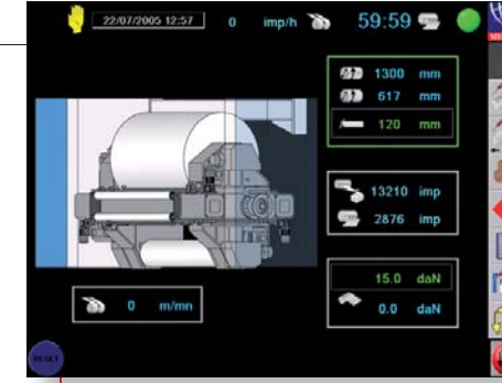
Die Verwendung eines Berührungsbildschirms ermöglicht dem Bediener eine einfache Steuerung und schnellen Zugriff auf Informationen.