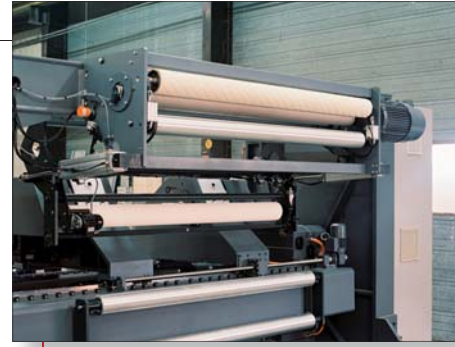
Der Klebearm wurde neu entwickelt, um den Abstand zwischen der Kleberolle und dem Messer zu minimieren und somit die Effizienz der Klebung auf über 99,5 % zu steigern.