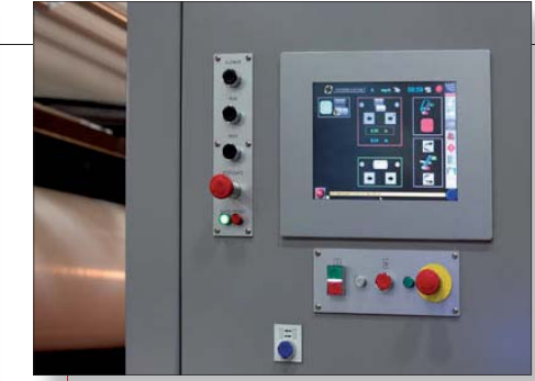
Steuertafel und WEBVIEW.