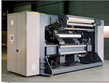
Turret-Drehrahmen mit geteilten Tragarmen, 4-Quadranten Motore an jedem Arm für Antrieb und Bremsung, schwenkbarer Klebearm und Tänzerwalzen-Baugruppe.